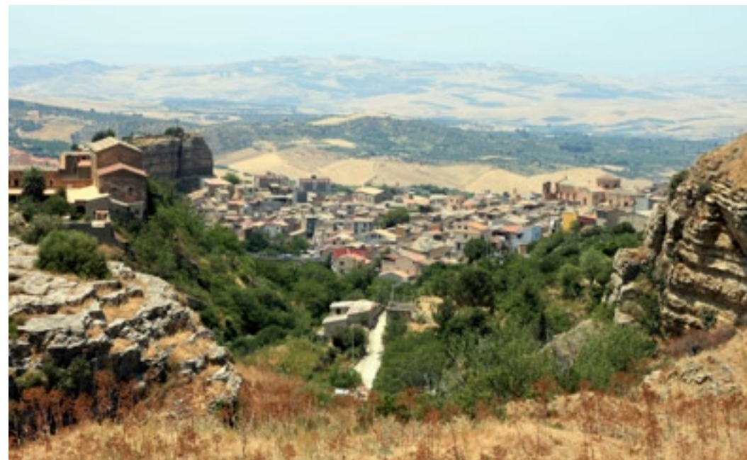
CORLEONE, HEIMAT DER LEGENDEN

Es ist ein barbarisches, ein archaisches Schauspiel, welches sich den seltenen Besuchern bietet. Aber anders als beim spanischen Stierkampf, bei dem das Töten zu einem Touristenschauspiel mittelprächtiger Toreros verkommen ist, ist die „Mattanza“ sich selbst genug. Fremde werden hierbei gerade noch geduldet, mehr nicht. Die Männer töten, weil sie und ihre Familien überleben und sich ernähren wollen – das ist der einzige Grund.