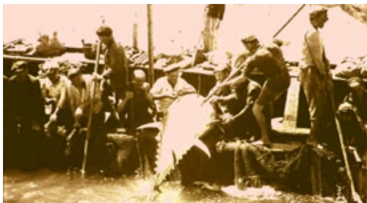
LA MATTANZA: ÜBER GENERATIONEN UNVERÄNDERT

Todeskammer dicht unter der Meeresoberfläche zusammenschließt. Kurz darauf beginnt das Meer zu kochen, Flossen peitschen die Wellen, Tunfische zischen wie Torpedos durch das Wasser; ein jeder von ihnen bis zu 270kg schwer. Ein lauter Schrei ertönt, „Una“, und die Männer schlagen gewaltige Haken in die Leiber der Fische. Manchmal kann ein Tunfisch sich mit enormer Kraft blutend wieder losreißen, eine Chance hat er jedoch nicht. Die Jäger stoßen immer wieder zu, das Meer färbt sich rot, die Gesichter der Männer werden von rosafarbener Gischt bedeckt. Auch für sie birgt der Tötungsakt Gefahren: die kräftigen Schwanzflossen der Fische hinterlassen tiefe Wunden, manchmal fällt ein Fischer ins Meer und ertrinkt inmitten der panisch um sich schlagenden Körper.