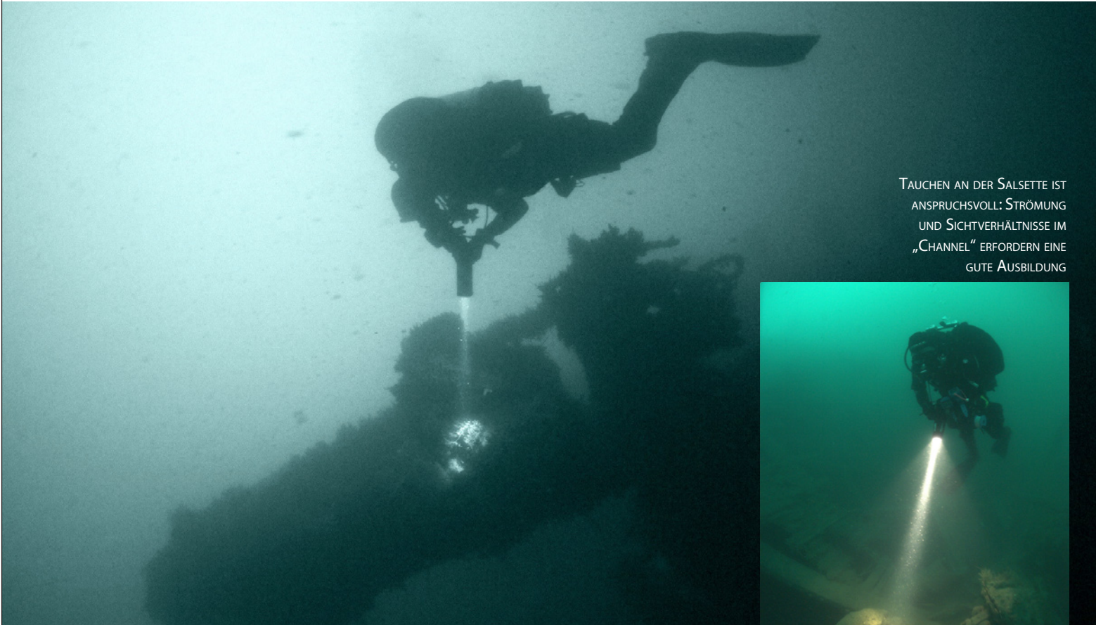
TAUCHEN AN DER SALSETTE IST ANSPRUCHSVOLL: STRÖMUNG UND SICHTVERHÄLTNISSE IM „CHANNEL“ ERFORDERN EINE GUTE AUSBILDUNG