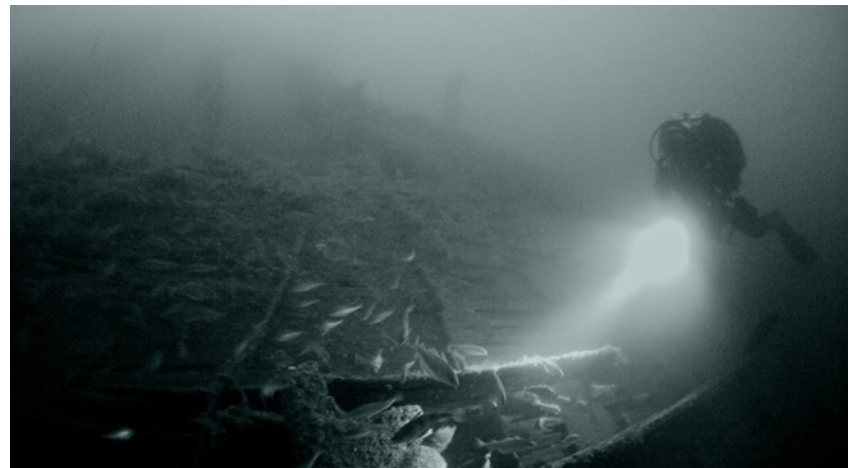
RUMPF UND STRUKTUR DER SALSETTE SIND WEITGEHEND INTAKT. EINE AUSNAHMEERSCHEINUNG UNTER WRACKS DIESEN ALTERS

Die Salsette kann ganzjährig betaucht werden, bedingt durch die exponierte Lage und der vorherrschenden Süd-West Winde empfehlen sich die Sommermonate als beste Zeit für ausgiebige Erkundungen. Strömungsverhältnisse und Tiefe erfordern einiges an Erfahrung; die Salsette ist kein Wrack für Anfänger. Für ausgiebige Erkundungen sollte man eine Woche Zeit mitbringen und die Tauchgänge jeweils mit mehreren Staigeflaschen planen. Nur kurze Ausflüge zu diesem wunderschönen Wrack werden der „alten Dame“ nicht gerecht. SJ