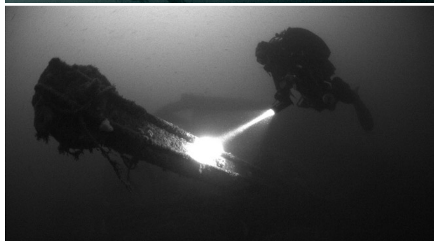
EIN INTAKTER KRAN RAGT AN DER HECKSEKTION INS FREIWASSER