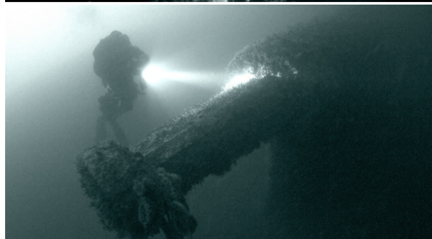
DIE MÄCHTIGE ANTRIEBSWELLE AUF STEUERBORDSEITE. DIE SCHRAUBE WURDE VOR JAHREN GEBORGEN