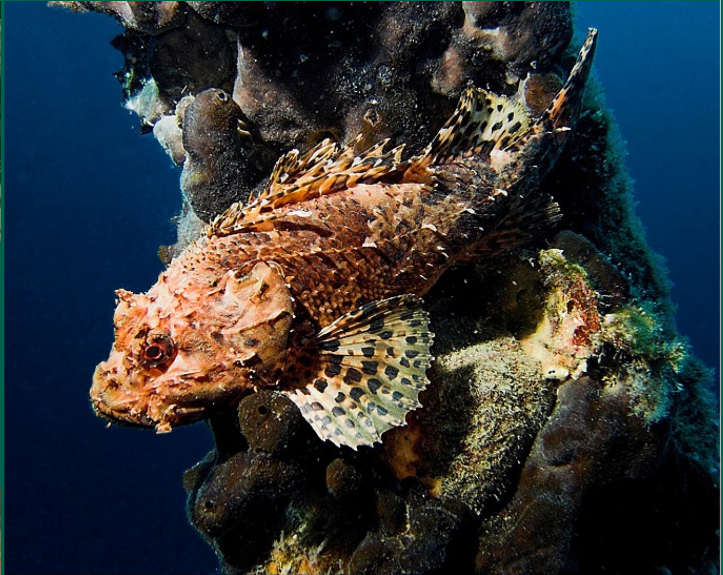
WRACKS GEHÖREN ZU DEN BEVORZUGTEN PLÄTZEN VON DRACHENKÖPFEN