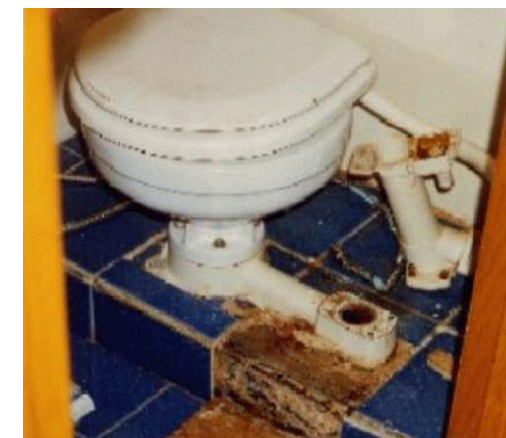
SANITÄRANLAGEN WIE DIESE SIND EIN FALL FÜRS GESUNDHEITSAFAMT; SO WAS GIBT'S NUR LEIDER NICHT FÜR ÄGYPTISCHE SAFARIBOOTE

Doch Taucher treiben nicht nur im Roten Meer ab. Wer dabei stets das „deutsche Hausriff Ägypten“ vor Augen hat, irrt: Im Januar 2008, Malediven, trieb ein Taucher acht Stunden im Meer, wurde aber entdeckt und gerettet. März 2008, Teneriffa, zwei tote Taucher. Zeitgleich in Schottland ein Taucher, ebenfalls tot. April 2008, Niederlande, ein Toter. In Taiwan waren es acht Taucher, die 40 Stunden auf See trieben und gerettet wurden. Mai 2008, vier Fälle, einer in Schottland, ein Taucher, tot. Australien, zwei Taucher trieben 20 Stunden im Meer, bis auch sie gerettet wurden. Ägypten, zwei Taucher, beide tot. Juni 2008, Irland, vier Taucher, sie trieben zwei Stunden dahin und überlebten. In Indonesien