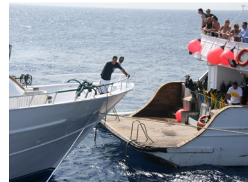
ANKERMANÖVER SIND NICHT JEDEN ÄGYPTISCHEN KAPITÄNS SACHE. KOLLISIONEN AN STARK BESUCHTEN TAUCHSPOTS WIE HIER AN DER „THISTLEGORM“ GEHÖREN ZUR TAGESORDNUNG

Wer eine Reise bei einem Reiseveranstalter oder in einem Tauchreisebüro bucht, kauft nicht einzelne Reisemodule. Anreise, Flug, Hotel, Tauchen ... alles bildet für ihn eine Einheit. Die Veranstalter stellen eine Reise zusammen, werden in den Augen des Tauchers sozusagen zum „Reisehersteller“. Die Fallstricke werden erst sichtbar, wenn eines der