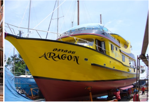
BILDER VOM BAU DER „MV ARAGON“, EINEM SCHIFF DER DEUTSCHEN TAUCHBASIS „SEA BEES“ IN THAILAND. EIN PRAGMATISCHES BEISPIEL, WIE EINFACHE HANDWERKSARBEIT EIN BOOT MERKLICH STABILER MACHT!