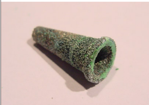
DIESER SINTERFILTER HAT BEREITS GRÜNSPAN ANGESETZT. ER LÄSST KAUM MEHR ATEMLUFT PASSIEREN UND IST ZUDEM EIN GESUNDHEITSRISIKO

Generell hilfreich, aber gerade nach Tauchgängen im Salzwasser Pflicht, ist das Spülen des Jackets mit klarem Süßwasser. Man füllt das Jacket mit Frischwasser auf, schüttelt es eine kurze Zeit und