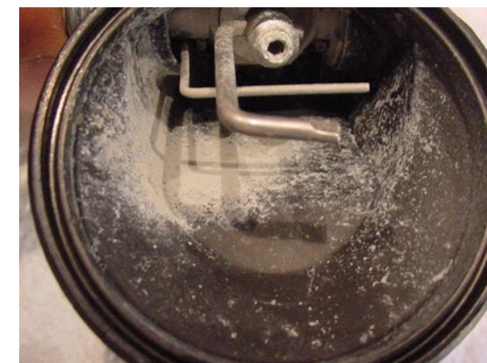
WÄRE ES EIN SUPPENTELLER, WÜRDEN NIEMAND DARAUS ESSEN. AUS DIESER ZWEITEN STUFE SOLLTE AUCH NIEMAND ATMEN