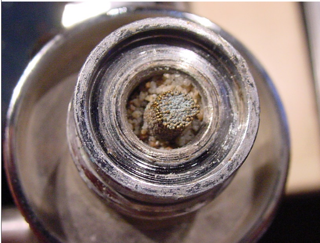
OHNE WEITEREN KOMMENTAR: DER SINTERFILTER IST BEREITS FEST IN DER ERSTEN STUFE „VERBACKEN“.

entleert es über alle Ablässe. Wer dann noch die Schnellablässe abmontiert und das Jacket auf einen speziellen Bügel aufhängt, erhält ein halbwegs trockenes Jacket, das viele Jahre gute Dienste leistet.