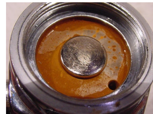
EIN GEMÜTLICHES „ROST-BETT“ FÜR DIESEN ÜBERTRAGUNGSKOLBENS EINER ERSTEN STUFE