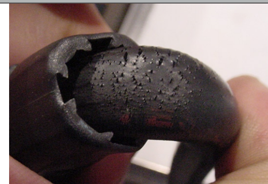
LUFTDRUCKSCHLÄUCHE ALTERN, WERDEN BRÜCHIG UND PLATZEN. BEI HOCHDRUCKSCHLÄUCHEN WIE AM FINIMETER ENTWEICHT DANN MITUNTER LUFT MIT 200 BAR DRUCK!

Die Folge eines defekten Inflators wäre, dass er permanent oder unkontrolliert Luft nachführt und so das Jacket aufbläst. Oder der Totalausfall: das Jacket kann nicht befüllt werden. Variante Nr. 3: Ständiges oder unkontrolliertes Abblasen.