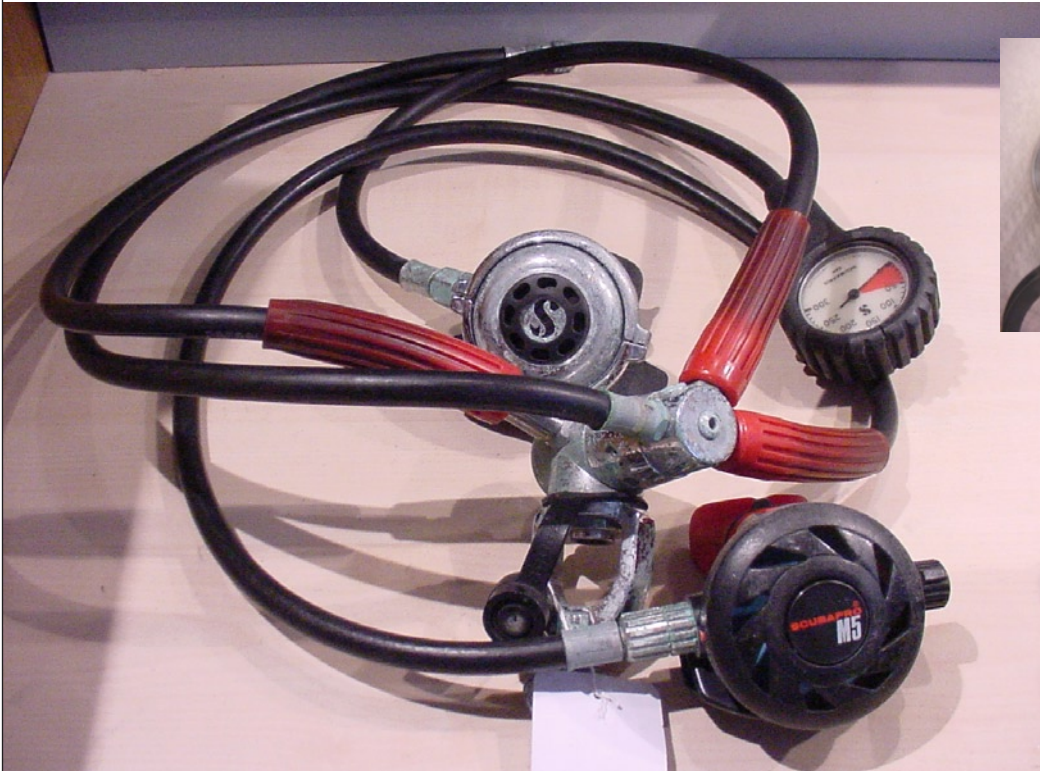
VERGAMMELTES EQUIPMENT WIE DIESES LANDET OFT AUF DEM TISCH DES „EQUIPMENT-DOKTORS“.

Wer sein Tauchequipment nicht pflegt und wartet, riskiert Funktionsstörungen bis hin zu Totalausfällen. Ein klemmender Reißverschluss eines 5-mm-Neoprenanzuges ist sicher nervig, was die Tauchsicherheit betrifft jedoch harmlos. Betrifft der „Klemmer“ einen Atemregler, kann dies tödlich enden.