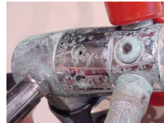
AUSSEN PFUI, INNER SICHER NOCH MEHR. STARKE OXIDATION AN DER SONST GLÄNZENDEN CHROM-OBERFLÄCHE EINER ERSTEN STUFE