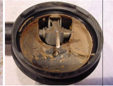
SCHLECHTE ZUSTÄNDE DES ATEMREGLERS WIE DIESE SIND LEBENSGEFÄHRLICH, TOTALAUSFÄLLE VORPROGRAMMIERT. SINTERFILTER WIE DIESE (FOTO MITTE) ERZEUGEN SCHLECHTE ATEMLUFT, STATT SIE ZU REINIGEN. SIEHT DAS INNERE DER ZWEITEN STUFE SO AUS, SIND SOGAR GESUNDHEITLICHE SCHÄDEN ZU BEFÜRCHTEN!

aber auch druckfest miteinander zu verbinden, bedarf es der Abdichtung. Dazu bedient sich die Technik der sogenannten O-Ringe. Ihr Tausch leuchtet ein, ist sinnvoll. O-Ringe erfüllen ihren Zweck nur im gequetschten Zustand, verlieren aber daher mit der Zeit ihre Form. Hinzu kommen Materialermüdung durch chemische, thermische und mechanische Einflüsse. Verschmutzungen und Ablagerungen wie beispielsweise Sand oder Salzurückstände nach dem letzten Tauchgang im Meer setzen den O-Ringen zu oder heben die abdichtende Wirkung auf. O-Ringe finden sich in allen Bereichen der Tauchausrüstung, in großen Mengen vor allem in den ersten und zweiten Stufen der Atemregler. Bei der Revision eines Atemreglers werden alle O-Ringen gewechselt.